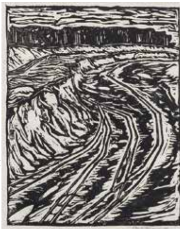
Josef Albers: Sandgrube I, 1916